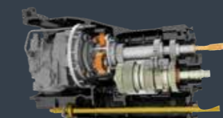
Stufenloses Getriebe von 0 bis 50 km/h