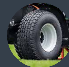
Individuelle Spezialbereifungen möglich