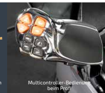
Multicontroller-Bedienung beim Profi