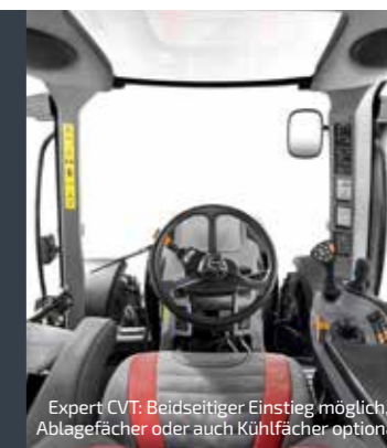
Expert CVT: Beidseitiger Einstieg möglich, Ablagefächer oder auch Kühlfächer optional