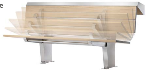
Mécanisme de pliage automatique