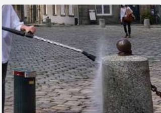
Lavage Haute Pression

Désherbeuse à eau chaude + Lavage Haute Pression / Eau Chaude