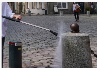
Lavage Haute Pression