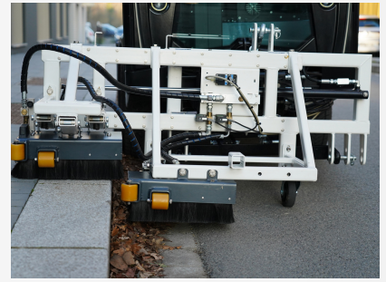
Rampe Dyn' 40x40