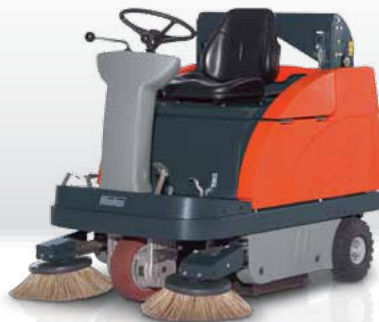
Sweepmaster B980 RH