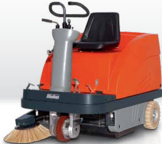
Sweepmaster B900 R