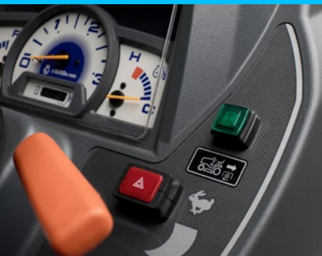
Aktivierungsschalter zum Rückwärtsmähen