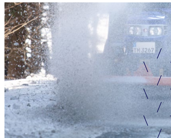
Schnee oder Schmutz – ISEKI Frontkehrmaschinen sorgen für eine saubere Lösung.

Die TM-Serie verfügt über 3 Anbauräume. Das bedeutet flexible Nutzungsmöglichkeiten zu jeder Jahreszeit.