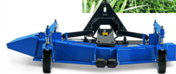
Optional mit ISEKI-Frontmähwerk zum schnellen An- und Abbau.