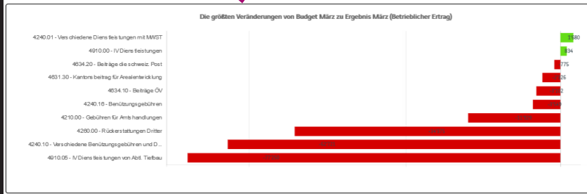
Die größten Veränderungen von Budget März zu Ergebnis März (Betrieblicher Ertrag)

Das Drill-Down-Prinzip wird auch in der unterjährigen Finanzsteuerung angewendet. Durch das Klicken auf die Trendpfeile in Ampelfarben werden im Weiteren automatisch die grössten Abweichungen grafisch dargestellt.