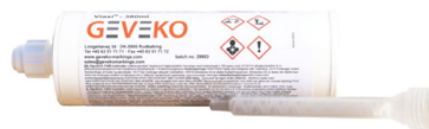
Mine 380 ml

Viaxi® ist ein effektives zwei Komponenten Bindemittel, das speziell für Beton-, Kopfsteinpflaster- und Fliesenoberflächen entwickelt wurde. Die geschätzte Anwendungsmenge ist ungefähr 300ml/m 2 , d.h. 220g/m 2 .