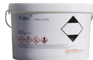
Eimer 3,5 kg