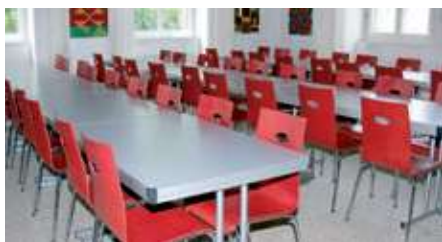
Abb. 3 : Beispiel einer Möblierung einer Schul-Kantine mit multifunktionaler Einrichtung. Die Wahl der Tischlängen von 1200 mm und 1800 mm bieten sehr viele Gestaltungsmöglichkeiten.

In der Breite dominieren im professionellen Bereich 80 cm. Dies ermöglicht es, ohne grosse Einschränkungen eine anständige Esstafel zu decken oder bei Schulungen und Konferenzen vor dem Laptop noch Schreibwaren oder ein Buch hinzustellen, bzw. bei Doppelbestuhlung noch einen kleinen Zwischenraum zum Tischnachbarn zu schaffen. Wenn der Tisch nur eine untergeordnete Rolle spielt oder eine andere Funktion erfüllen soll, sind auch Breiten von 60 bis 70 cm denkbar und für Schulungszwecke sind auch Tische mit 40 cm Breite erhältlich. Andererseits bietet ein Tisch mit der Breite von 90 bis 100 cm viele Gestaltungs- und Dekorationsmöglichkeiten bei speziellen Anlässen. Das Thema Höhe bietet immer wieder viel Gesprächsstoff. Während die einen ihren Essplatz nur 72 cm ab dem Boden wissen wollen, bevorzugen andere konsequent 75 cm Höhe mit der Begründung, dass die Menschen ja immer grösser werden. Vermutlich liegt der Idealfall auch da in der Mitte. Viel entscheidender als die reine Tischhöhe ist die Frage, zu welcher Stuhlhöhe sollen die Tische passen? Ergonomen empfehlen 300 mm Differenz zwischen Stuhl- und Tischhöhe als wichtigstes Kriterium. Konkret bedeutet dies, dass für einen Tisch mit der Plattenoberkante von 730 mm ein Stuhl mit der Sitzhöhe von 430 mm gewählt werden soll.